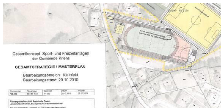
Abbildung 1: Ausschnitt aus Gesamtkonzept Sport- und Freizeitanlagen Kriens 2010

Diverse Sportarten und Freizeitaktivitäten benötigen zur Ausübung eine Halle. Die Turnhallen in Kriens sind knapp und stossen mittlerweile nicht nur im Winter auf ihre Kapazitätsgrenzen. Mit dem Bau der Pilatus-Arena wird eine neue grosse Halle in Kriens gebaut, welche allerdings auf Grossanlässe in der Zentralschweiz abzielt. Für die meisten Vereine und Kulturschaffende, für den Breitensport spezifisch, aber auch für die Schulen wird diese Arena kaum regelmässig zur Verfügung gestellt werden können. Im Masterplan der Stadt Kriens für Sport- und Freizeitanlagen wurde auf dem Tennenplatz ursprünglich mit einer 250m Rundbahn geplant. Dieser Plan wurde mittlerweile verworfen.